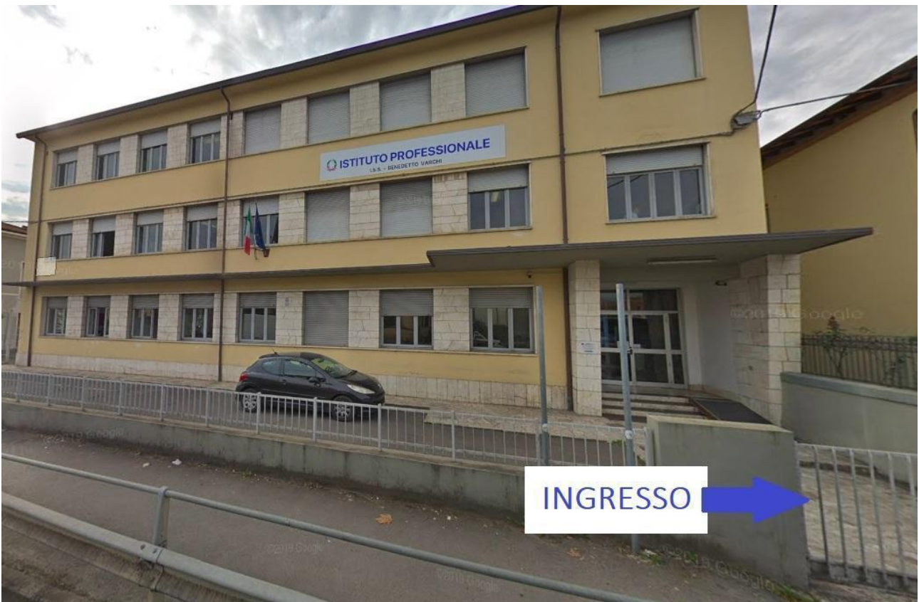
Foto Sede Istituto Professionale