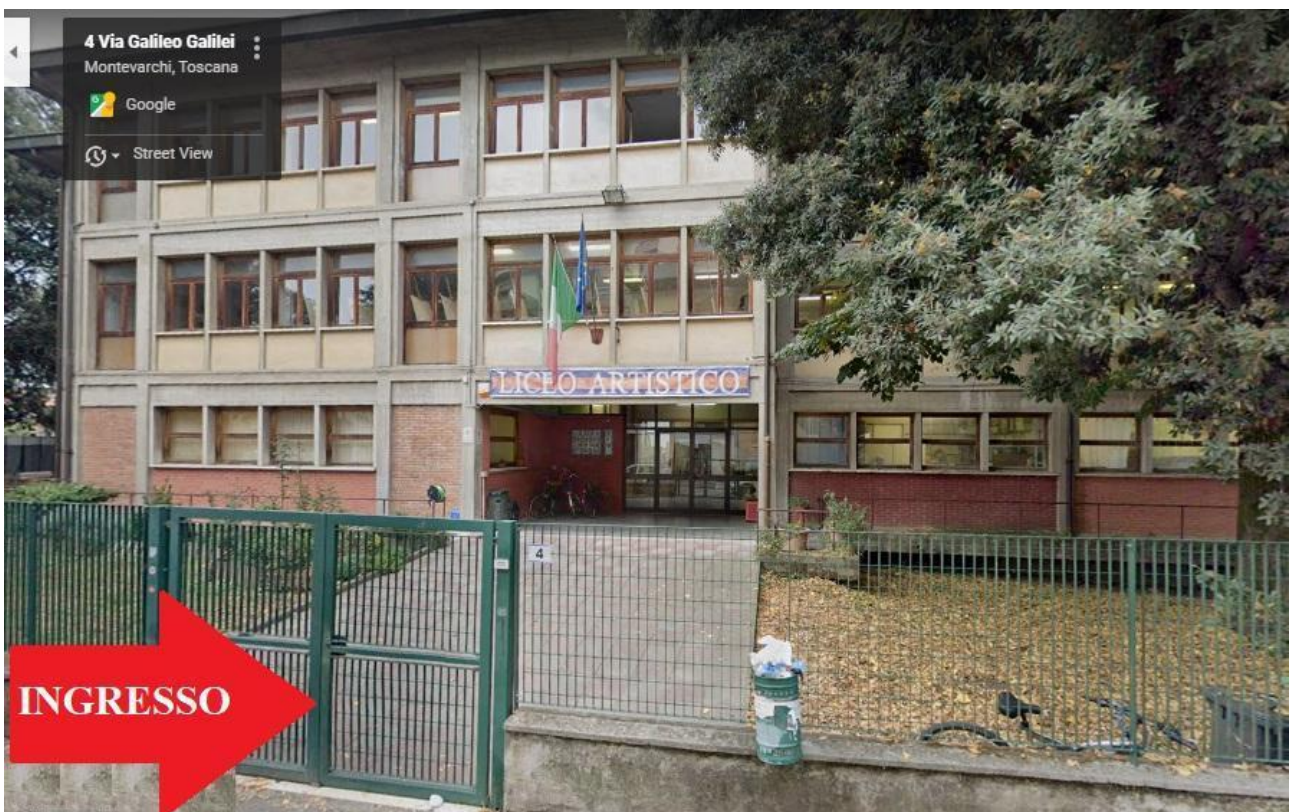
Foto Sede Liceo Artistico